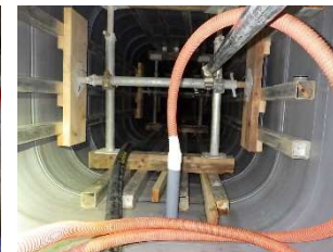
充填剤注入前ポンプ使用状況